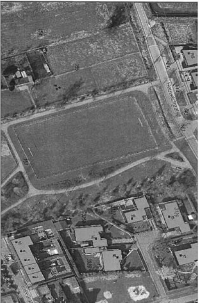
Realisatie multifunctioneel-buitensportveld Nistelrode